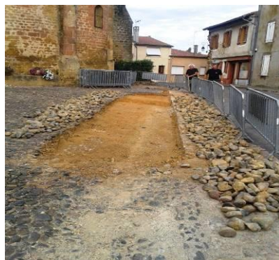
Calade, travaux en cours