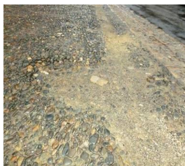
La calade en galets avant !!!